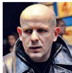
Олесь Бузина, публицист

— Правда заключается в том, что более бесчестных выборов у нас не было за все 23 года независимости. Наемные банды уличных экстремистов запугивают и избивают кандидатов, швыряя их в мусорники. Это членовредительство они почему-то называют «люстрацией». Да и со списками избирателей происходит откровенное жульничество. Присылают извещение из избирательной комиссии в субботу вечером с просьбой уточнить, есть ли мы в списке, а когда в понедельник мы приходим внести свое имя, нам говорят, что уже поздно. Но ведь в воскресенье комиссия не работала!