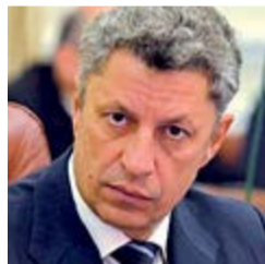
Юрий Бойко, лидер партии «Оппозиционный блок»

— В истории страны еще не было таких грязных выборов по отношению к оппозиции. Представителей блока запугивали и физически преследовали. Но представители «Оппозиционного блока» во вновь избранном парламенте готовы сотрудничать с властью ради мира на Востоке, в частности, в вопросах обеспечения всем необходимым жителей оккупированных территорий. Точно так же, как гуманитарная помощь туда проходит, надо так же договориться о выплате зарплат и пенсий, потому что если мы не будем выплачивать, значит, туда заплатят со стороны России. И эта территория автоматически перейдет в рублевую зону.